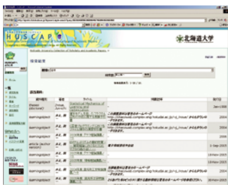
北海道大学附属図書館 HUSCAP検索画面

私は理論物理で学位をとったので、現在学部の講義を担当している情報工学コースでは、少々アウトサイダー気味の教員だが、着任当時、情報工学の全体像がつかめなくて困った。物理学ではまず、初等物理学(力学、電磁気学など)を学び、次に解析力学をやり、その後、量