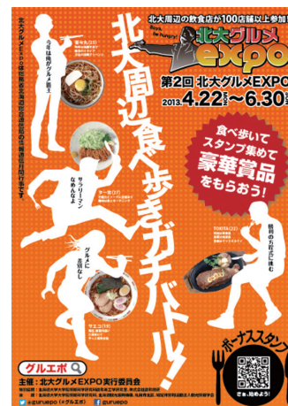
北大グルメExpoポスター画像

最後に、この場を借りて北大グルメExpoの参加にご協力いただいたすべての方々、団体、そして参加者の皆様に感謝の意を申し上げます。