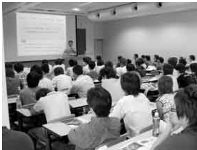
コース説明会（7 月 19 日実施）の様子