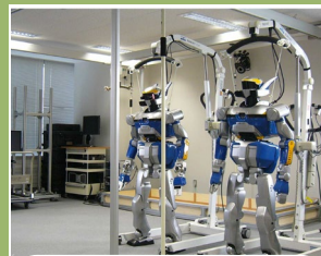
システム情報科学