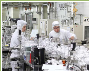
情報エレクトロニクス