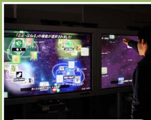
メディアネットワーク